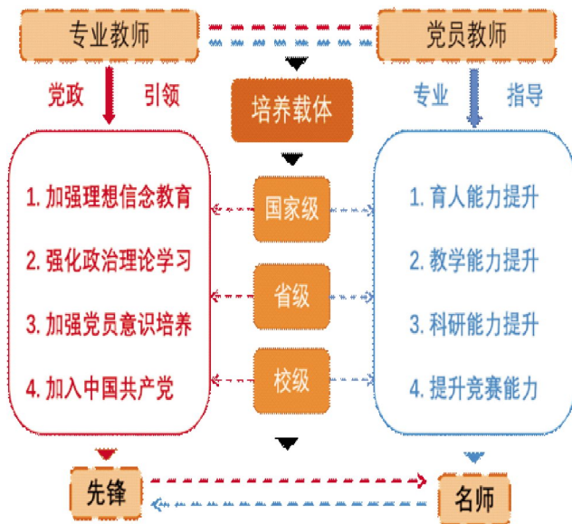
图2 课程思政基层教学组织教师培训体系

学院层面搭建培训平台，为专业课程思政基层组织打通培训通道，专业教师着重加强其理想信念教育，通过培训强化政治理论学习；学院层面加强党员意识培养，组织好非党员教师加入中国共产党的工作，利用培训为课程思政建设改革赋能，为教师个人能力提升赋能；党员教师通过培训提升其教学能力、育人能力、竞赛能力、科研能力，培养基层教学组织成员成为专业的教学先锋和教学名师。